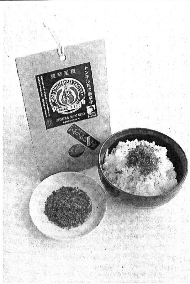
唐辛子の新調味料「やみつき・ふりかけ一味」

和洋中どの料理との相性も良い」という。 一袋三十坪入りで六百円。業務用二百坪も販売。問い合わせは「飛騨唐辛工房」電話0577(59)60311へ。 (安藤富代)